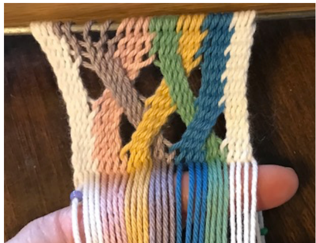
View after Row 8

Row 8 continue le tissu 28 Mailles normals