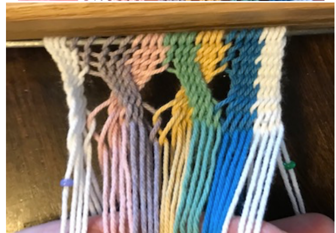
Vue après rang 4.

Rang 4 continue le tissu 28 Mailles normals