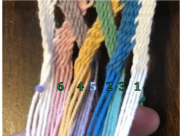
Re-set the order of the threads

Apportez l'onglet 4 (fils avant et arriér) en avant de l'onglet voisin 5. Apportez l'onglet 2 en avant de l'onglet 3.