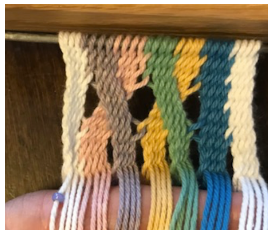
Vue après rang 6.

Puis Maille de lisière droit 5 Mailles normals Maille de lisière gauche